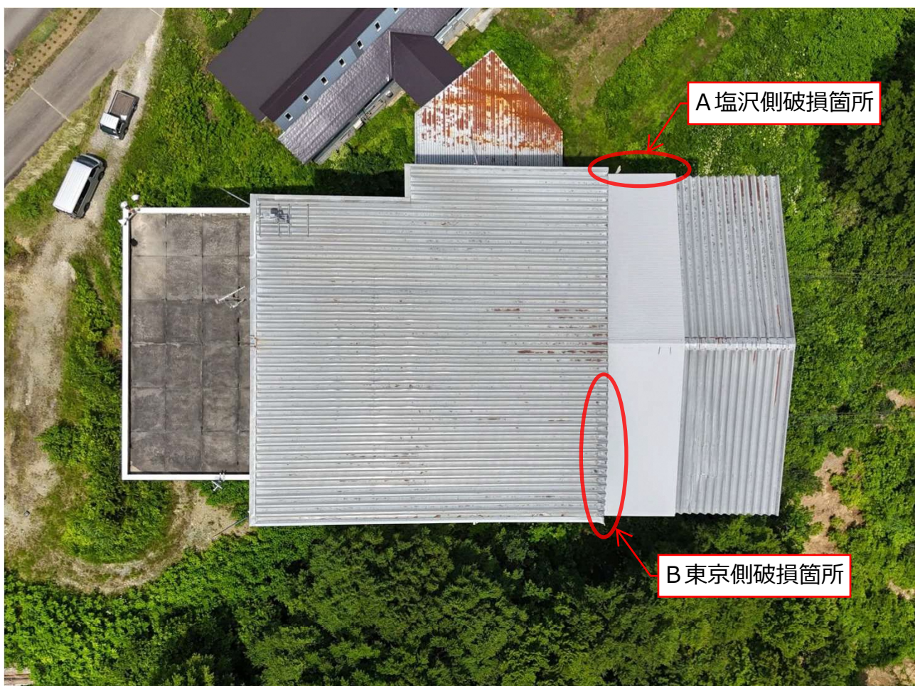
湯沢高原ロープウェー山頂駅舎屋根雪害復旧