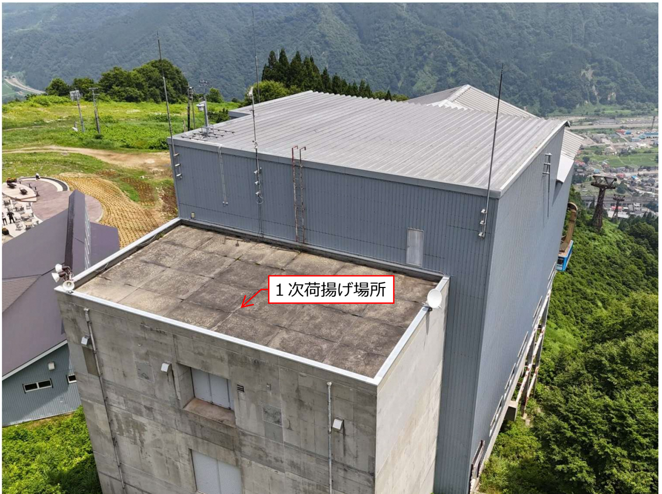
湯沢高原ロープウェー山頂駅舎屋根雪害復旧