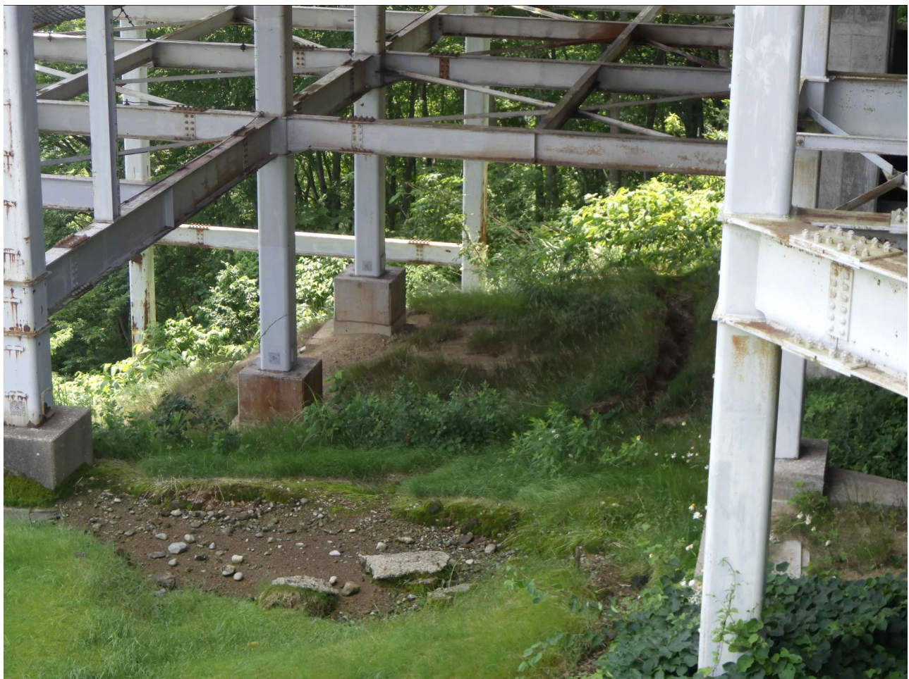
湯沢高原ロープウェー山頂駅舎屋根雪害復旧